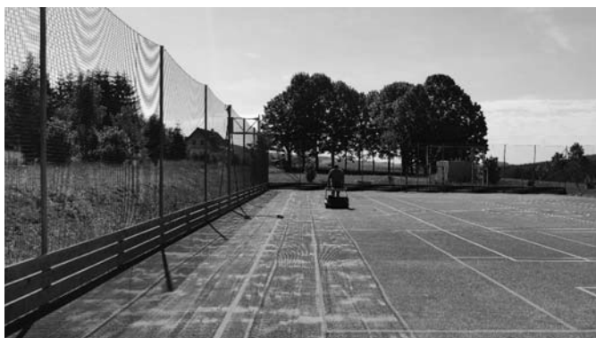
Údržba povrchu víceúčelového hřiště